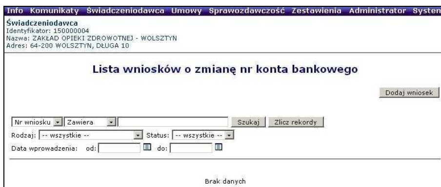
Rys. 6.46 Lista wniosków o zmianę numeru konta bankowego