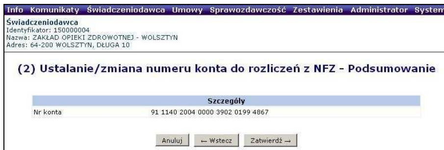
Rys. 6.48 Zmiana numeru konta do rozliczeń z NFZ - Podsumowanie

Po wprowadzeniu wszystkich wymaganych przez system danych można przejść do kolejnego okna przy pomocy opcji Dalej . W drugim etapie dodawania nowego wniosku o zmianę konta bankowego zostanie wyświetlone Podsumowanie , które należy zatwierdzić: